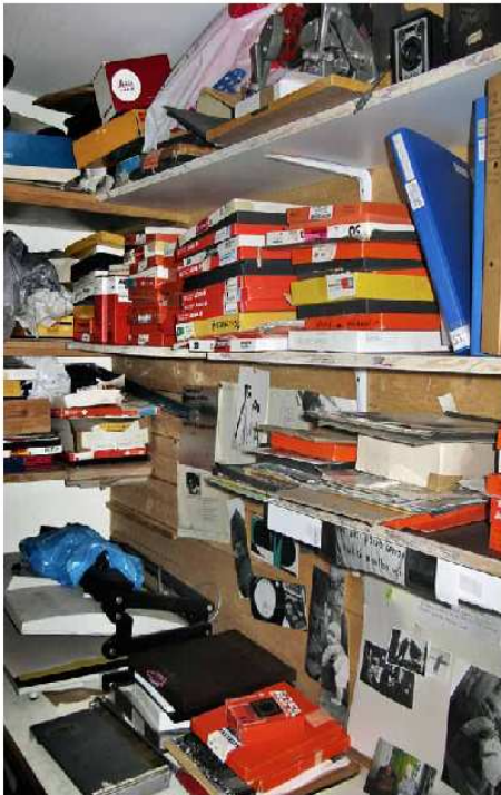
Negatiivimappeja ja työvedoksia kokoelman alkuperäisessä ympäristössä valokuvaajan työhuoneessa.